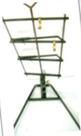
Asador chico 0.68x0.50cm