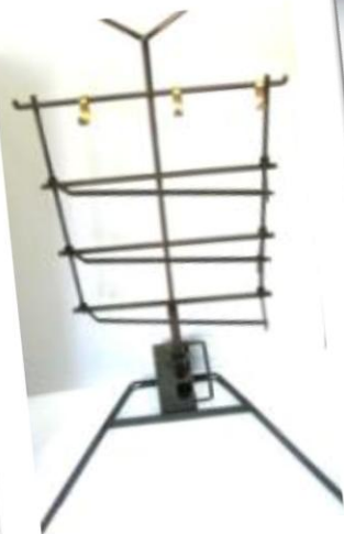
Asador mediano 1.05x0.55cm