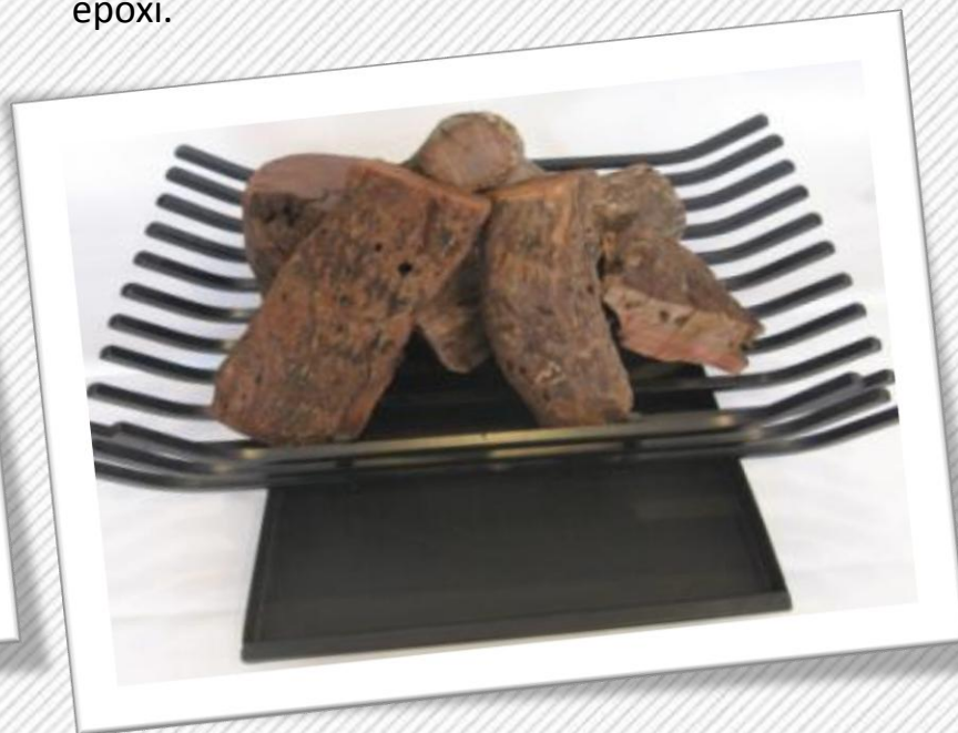
Grilla con cajón cenicero