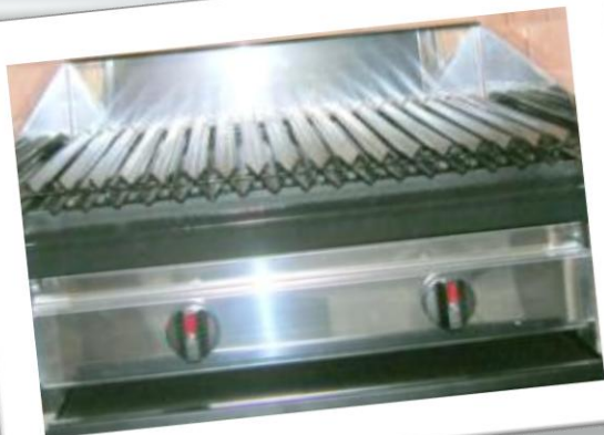
Parrillas Altagama Revestida en acero inoxidable.