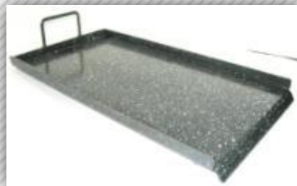
Plancha Bifera Enlazada 0,32 x 0,54m