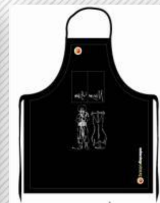
Modelo Asador Criollo