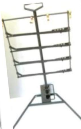
Asador grande 1.20x0.77cm