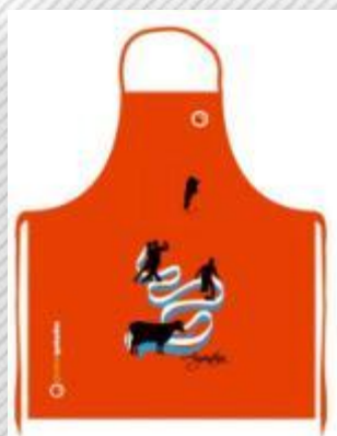
Modelo Icono Argentino