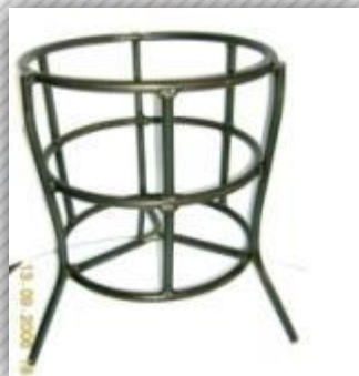
Leñero para asador

Cepillo Trebia con mango de madera, Espátula para limpieza de herrajes Fibra limpiadora parrillera 3M.