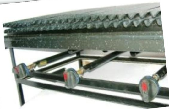
Parrillas Confort Sin revestimiento